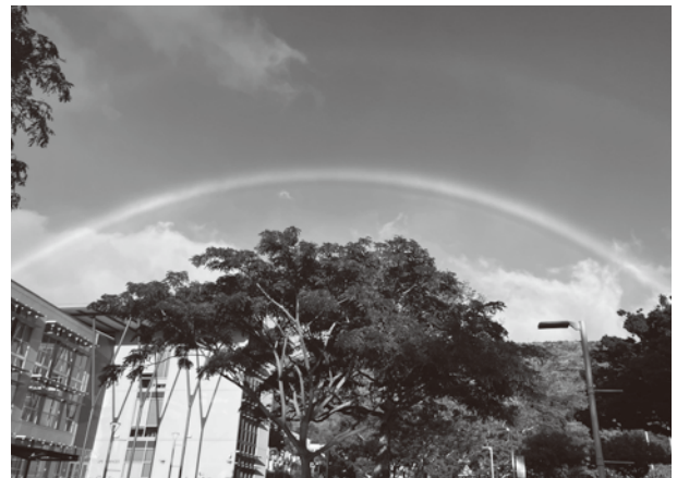
キャンパスで見た虹

ロータリー奨学生として支援を受けている責任を自覚し、今後も学業・研究・地域との交流を通じて、相互理解と平和に資する活動へとつなげていきたいと思ひます。